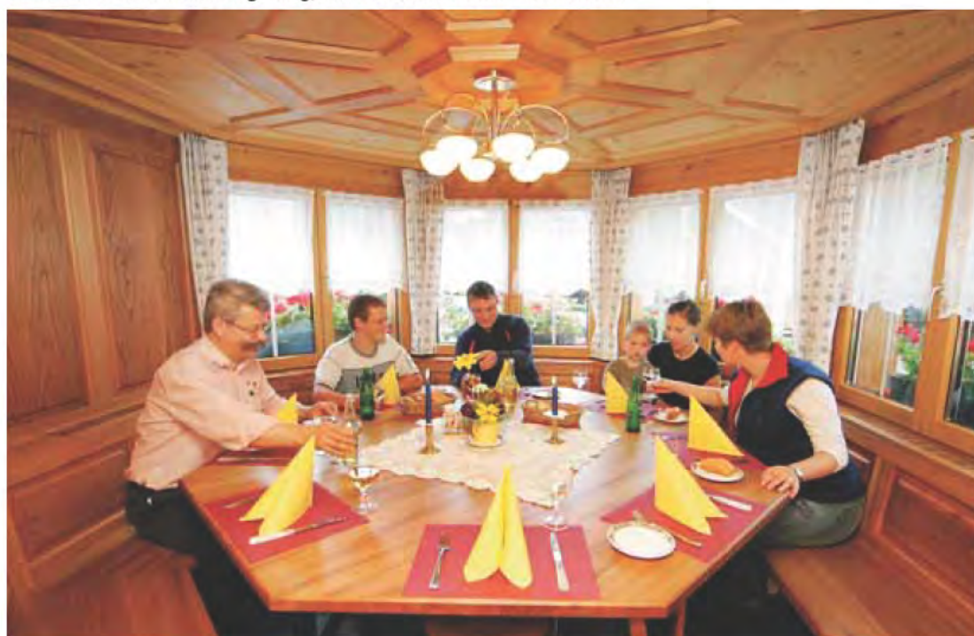
Der schönste Tisch in der Umgebung, unser Türmlitisch für 8 – 10 Personen

Das jüngste Hotel verbunden mit dem ältesten Restaurant im Ort.