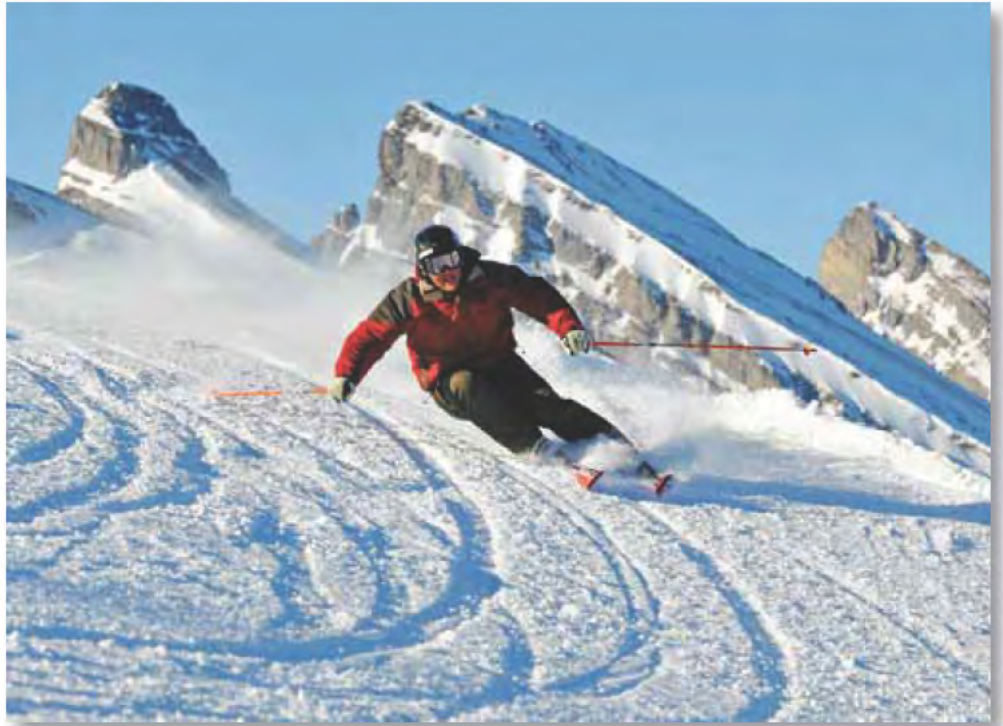
Winterkarte Bergbahnen Toggenburg AG